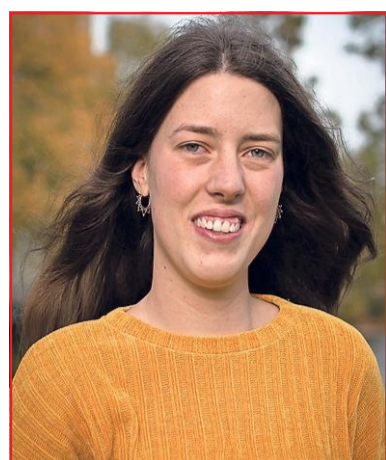
Thema: Backstage