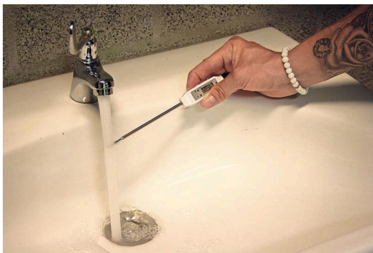
Elke dag wordt de watertemperatuur van alle kranen gemeten.